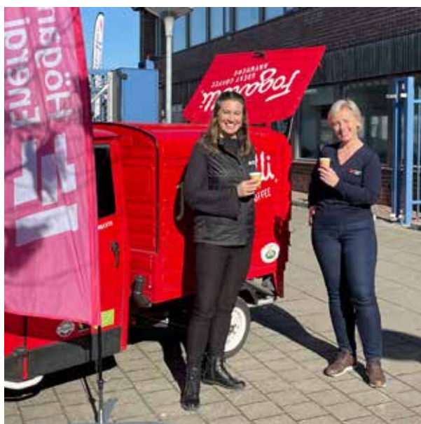
Höganäs Energi bjöd på nybryggt kaffe från Fogarolli till alla besökande på jobbmässan.

Som elnätskund kan du ha rätt till avbrottsersättning om ett elavbrott varar under en sammanhängande period om minst tolv timmar. För närvarande är lägsta ersättningsnivå 1 100 kr.