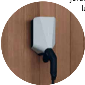
Liten och diskret laddare som passar de flesta hem.