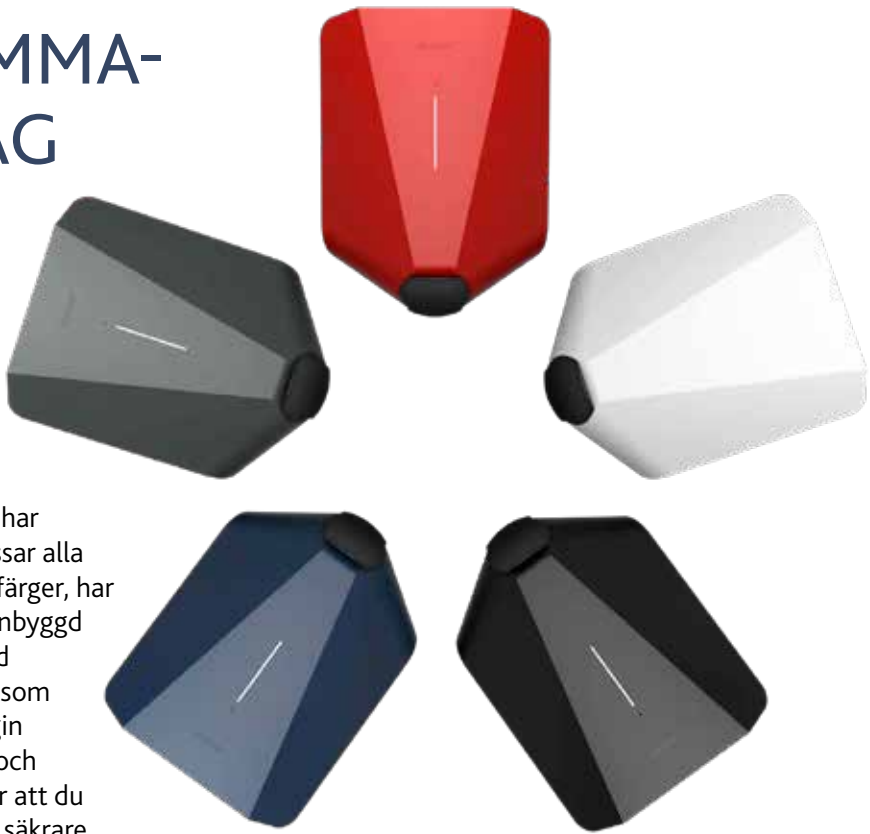
Easee laddaren finns i fem olika färger. Välj den färg som passar bäst hemma hos dig.

laddaren kan du ha equalizer som balanserar den totala energin mellan laddningsroboten och fastigheten. Detta innebär att du kan ladda både smartare, säkrare och snabbare. Easee är producerad i Norge för nordiska förhållanden.