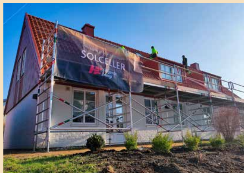
Ett av många hus på Kullahalvön där Höganäs Energi Handel och vår samarbetspartner Solutec Energiteknik installerar solcellspaneler.

Läs på vår hemsida hoganasesenergi.se/solceller —batteri eller kom och prata med oss på öppet hus den 21 september.