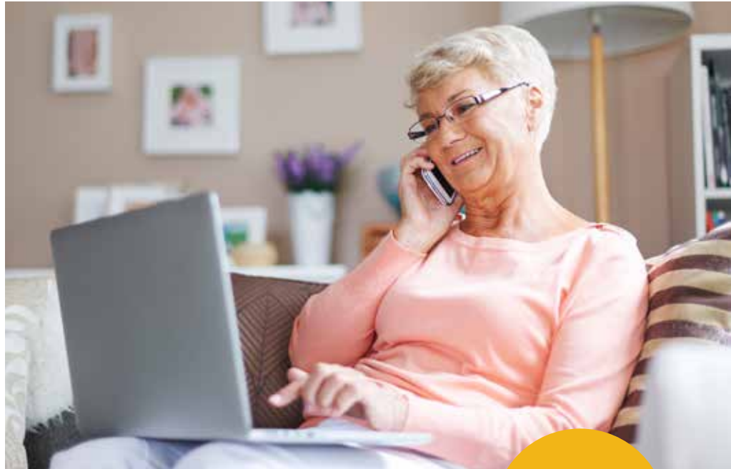
Med fiber garanteras du snabb och stabil uppkoppling.

Beställ fiber för 26 900 kr ord. pris 31 900 kr exkl. grävning